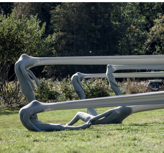
Tekstilkunstneren Malin Bülow - Referansefoto: Firkanta Elastisitet (2017).