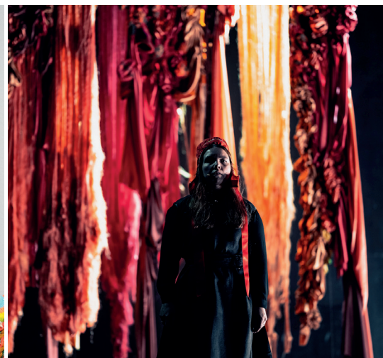
«Vástádus eana – The answer is land» av koreograf Elle Sofe Sara