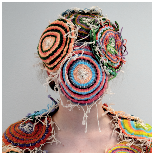
Alter Ego av designer Fredrik Tjærandsen og koreograf Mathilde Caeyers Foto: Fredrik Tjærandsen